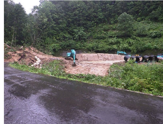
国道105号線土砂撤去、仮設道路設置 (8月の前線による豪雨) (一社)秋田県建設業協会