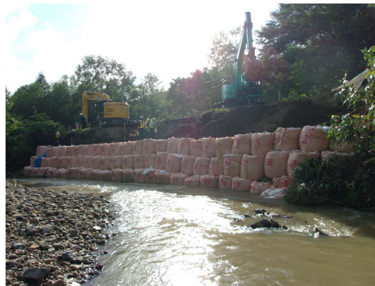
道道の遠別中川線で道路法面復旧作業 (8月の集中豪雨) (一社)北海道建設業協会