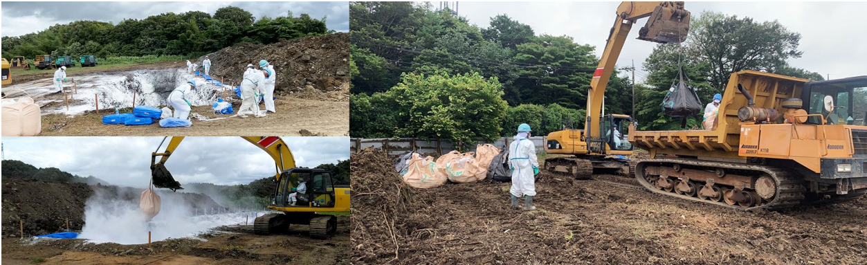
【豚熱】 那須烏山市の養豚場の防疫措置での埋却箇所掘削および埋却作業 (7月～9月) (一社) 栃木県建設業協会