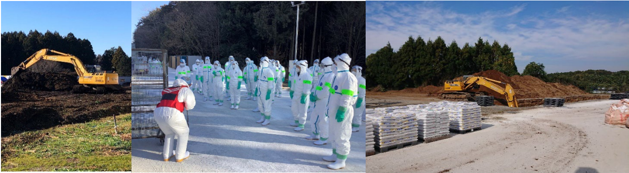
【鳥インフルエンザ】 城里町の養鶏場の防疫措置での埋却箇所掘削及び埋却作業 (令和5年1月) (一社) 茨城県建設業協会

※令和4年10月28日に国内1例が確認されて以来、令和5年4月14日14時現在までで26道県で84事例発生し、約1,771万羽の処分を行っている。