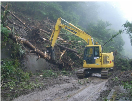
北杜富士見線の土砂崩落による応急復旧作業 (8月の前線による豪雨) (一社)山梨県建設業協会