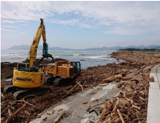
延岡港海岸で台風14号による漂着物撤去 (9月の台風14号) (一社)宮崎県建設業協会