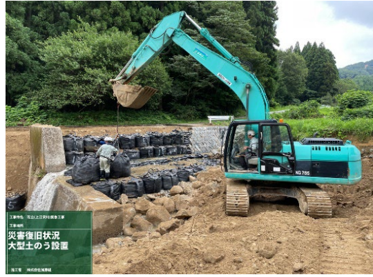
上江沢川での土石流による緊急復旧作業 (8月の前線・台風8号による豪雨)