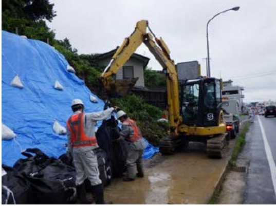
国道4号土砂流出による撤去等作業の様子 (7月の前線による豪雨) (一社)宮城県建設業協会