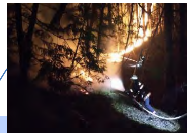
3月4日、大船渡市小石浜地区