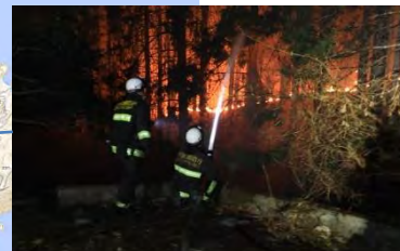
3月3日、大船渡市綾里地区