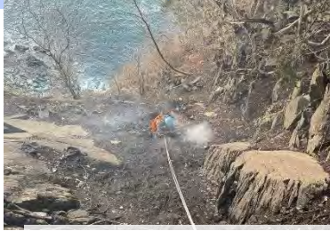
3月9日、大船渡市合足地区