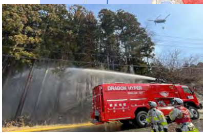
3月4日、大船渡市西側海岸地区

引き続き、鎮火に向け、空中及び地上からの巡回警戒を行い、必要に応じて消火活動を実施。