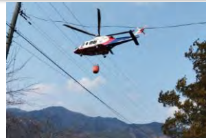
消防防災ヘリコプターによる消火（全域）